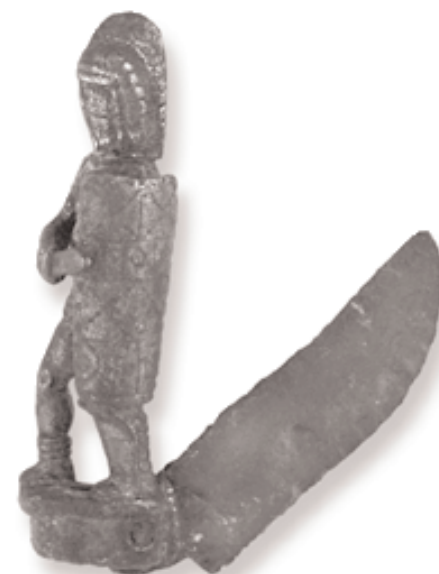
Fig. 1 — Le couteau pliant en forme de gladiateur découvert à Saint-Patrice (Indre-et-Loire) Éch. 1/1.

Thibaud Guiot Inrap - Centre - Ile-de-France 11, rue de Fouchault F-37190 Vallères