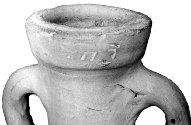
Figura 7 — Bollo (T) HB su orlo dell'anfora Dr 6A di Gavello.

(Toniolo 1991, p. 17-20, fig. 8, 9). Le anfore Lamb. 2 vengono per Altino chiamate Adriatica 1 e Adriatica 2 date le differenze delle forme fra di loro. Le anfore Lamb. 2 avevano simile distribuzione come le loro discendenti Dr 6A (Cipriano, Carre 1989, p. 67-104 ; Buora 1998, fig.7, 8, 9).