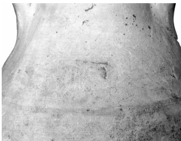
Figura 6 — Bollo sulle spalle dell'anfora Dr 6A di Gavello.