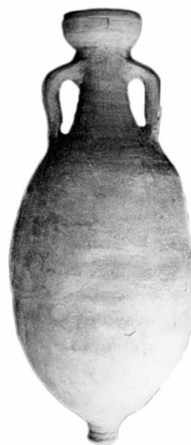
Figura 3 — Anfora Dr 6B di Gavello.

La anfora di Gavello (fig. 3) è la classica Dr 6B e ha bollo quadrangolare impresso sull'orlo, ove leggiamo le lettere APIC (fig. 4). Dalle vicinanze di Altino si conoscono le anfore ante 6B bollate APICI e SEPULLI. Il bollo APICI può essere la stessa marca del produttore che poi produceva le Dr 6B segnate APIC. Il bollo è ben fatto, con netto taglio delle lettere impresse in argilla depurata. La terracotta è dura e ben depurata come era nel caso della anfora ante 6B di Altino. Secondo E. Buchi le anfore Dr 6B servivano per varie merci, come si dice per uso polivalente (Buchi 1974-1975, cc. 431-444). Il colore dell'argilla di queste anfore varia molto e perciò si suppo-