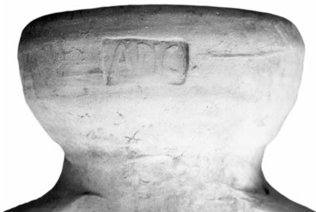
Figura 4 — Orlo bollato APIC dell'anfora Dr 6B di Gavello.

ne una vasta area di produzione delle Dr 6B in tutta la zona costiera della Pianura Padana ed Istria (Bruno 1998, 329-345). Grande quantità di queste anfore vi é a Magdalensberg e Teurnia. Nei recenti scavi dell'anfiteatro di Virunum potevamo accertare direttamente la prevalenza di queste anfore sugli altri tipi di contenitori. E' probabile, che le anfore venissero esportate oltre le Alpi dalla metà del I sec. a.C. quando si sviluppano le attività di produzioni istriane (Buchi 1987, p. 105-184 ; Modrzewska-Pianetti 1999, p. 103-108). Queste anfore potevano rimanere per uso polivalente, come dimostra un'anfora Dr 6B proveniente da Adria, ritrovata nei contesti dei primi decenni del I sec. d.C., che conservava all'interno la resina, ciò che indica il vino come contenuto (Toniolo 1987, p. 103).