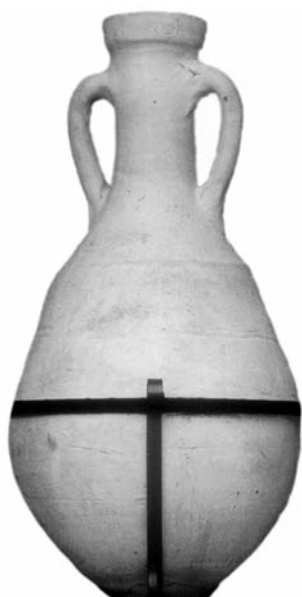
Figura 5 — Anfora Dr 6 di Gavello.