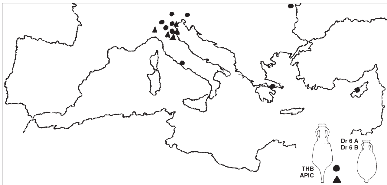
Figura 8 — Ritrovamenti di anfore bollate THB e anfore bollate APIC (illustrazioni I. Modrzewska).

della gens Apicia . Alla manifattura di Apici si attribuisce anche il nome servile Anencletus apparso sui laterizi (Zerbinati 1986, p. 263). Un laterizio è segnato APIC.APICITOR.S.F.T. cioè Apicius Apicitorum servus fecit tegulam oppure titulum . Le quattro varianti dei bolli degli Apici provengono dal territorio del medio Polesine e sono concentrati sopra-tutto presso S. Bellino, solo uno a S. Donato di Fiesso Umbertiano e un altro a Ca' Bianca di Villanova del Ghebbo (Zerbinati 1986, p. 265). Dato il numero dei prodotti bollati di questo o questi produttori si può pensare a piccole manifatture polesane. La concentrazione di ritrovamenti di laterizi e anfore bollate della gens Apicia suggerisce la localizzazione delle manifatture ceramiche negli agri veronesi, atestini e polesani. La famiglia è nota dalle iscrizioni di Verona ed Este e svolgeva la sua