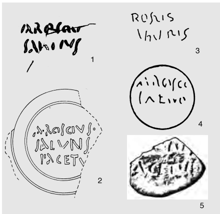
Fig. 1 — Marques des lampes de : 1, Aramon; 2, Xanten; 3, Rome; 4, Dangstetten; 5, Dalheim (éch. 3/4).

La nécropole du ler s. av. J.-C. du Paradis, à Aramon (Gard), a récemment fait l'objet d'une publication exhaustive (Genty, Feugère 1995). Parmi le mobilier figuré, notre attention a été attirée par la lampe de la tombe 8. Il s'agit d'une lampe incomplète, à ailerons, bec caréné et proto-volutes, dont le disque est orné d'un danseur grotesque et qui présente au revers une marque biligne, en cursive, non interprétée ( ibid. , fig. 34, t. 8).